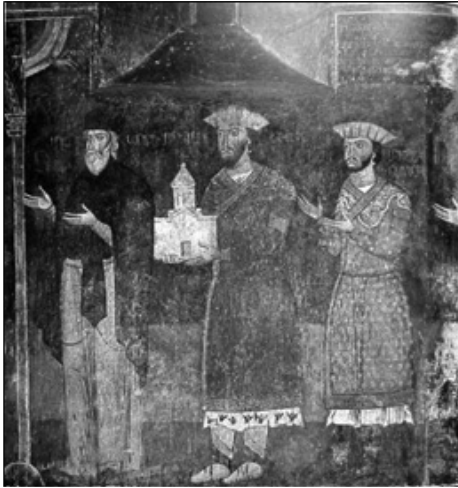
Görsel 1: Soldan sağa; Sargis Cakeli, Beka Cakeli ve II. Sargis Cakeli'yi tasvir eden Sapara Manastırı freski

Kısa zamanda bölgenin kudretli şahsiyetleri arasına giren ve Moğollar tarafından Kral II. Demetre ve Sadun'a verilen yerlerin dışında kalan bölgelerin kendilerine tahsis edildiği Sargis ve oğlu Beka Cakeli, Samtshe'nin yöneticisi idi. Ancak babasından daha çok isminden söz ettirmeye başlayan yetenekli ve cesur Beka; Tasiskari, Karnulaki, Samtshe, Acara, Şavşat, Klarceti, Göle, Karnipor, Valarşavan, iki Artan, Nigal Deresi, Tao'nun büyük bir bölümüne ve Javakheti'nin çok sayıdaki köyüne sahip oldu. Abaka Han'a hizmetleri karşılığında ondan aldıkları yardımlarla ve Kral II. Demetre ile ilişkilerini iyi tuttukları süre boyunca bu baba ve oğlun güçleri gittikçe arttı 15 .