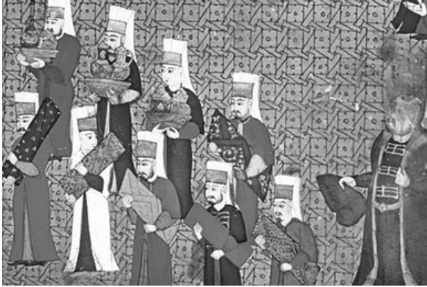
Görsel 4: Atabek Manuçehr Mustafa Paşa'nın Saray'da kabulünü anlatan bir minyatür

Birkaç hafta sonra Divan'da ihtida eden adama tam selâhiyetle, mutâd olan tımar karşılığı olarak bir idari bölge verildi. Diğer Bey Quarquare, kardeşi, ona yapabildiği ve istediği kadar yardım etmekle mükellefti. Ona keza bir çavuş da terfik edildi, bir isyan ve karışıklık husule gelmemesi, ona nezaret etmesi maksadıyla.” 57