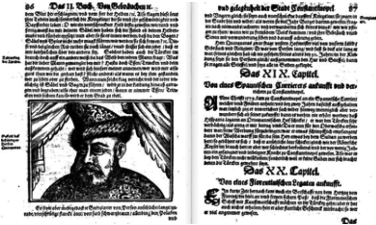
Görsel 3: Schweigger'in seyahatnamesinde Atabek Gorgora'nın portresinin yer aldığı sayfalar

"3 Haziran 1579'da İstanbul'a iki Gürcü prensi, takriben yüz elli kişilik hizmetkârlarıyla birlikte geldi. Muvasalatlarının sebebi şudur: